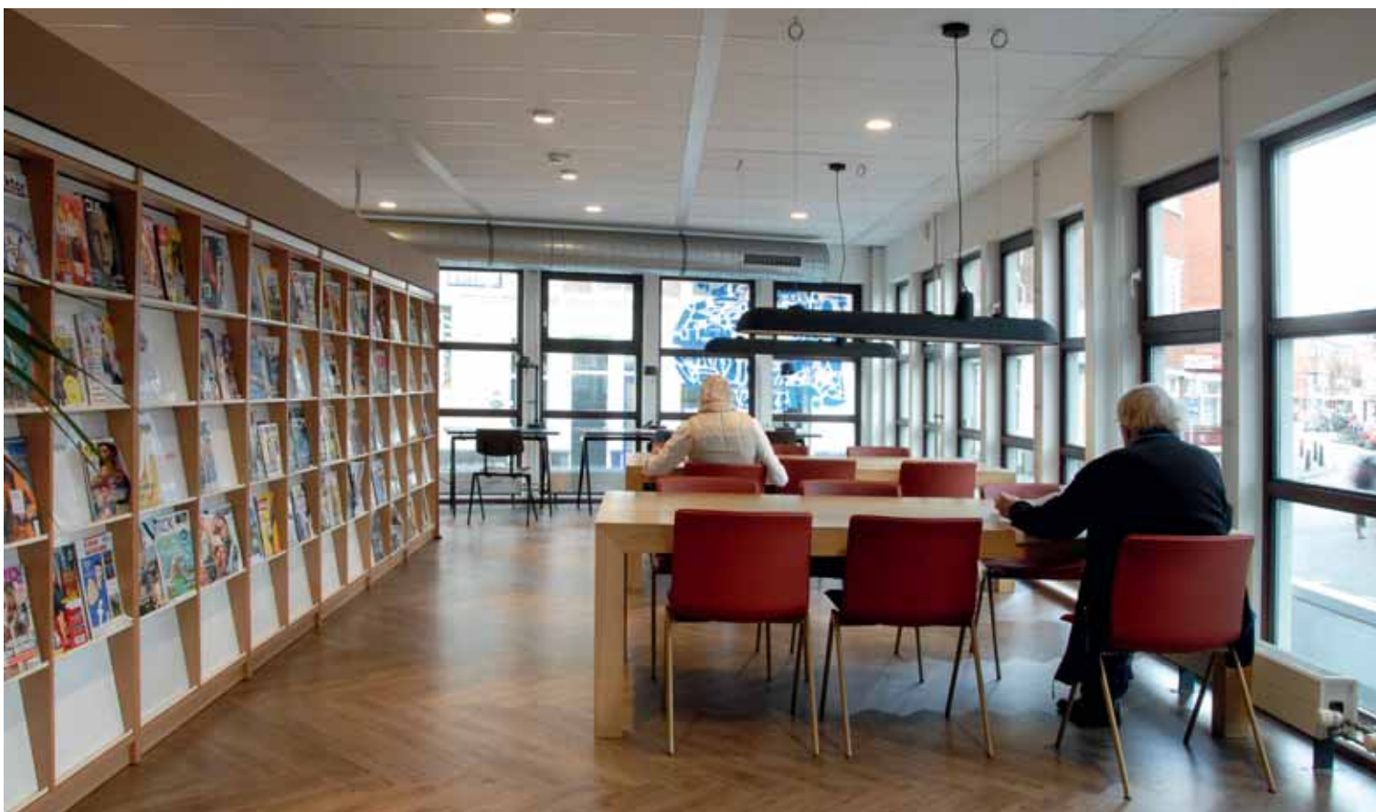
FOTO ONDER Leestafels met uitzicht naar buiten.

FOTO MIDDEN De op de hoeken verstevigde multifunctionele kisten.