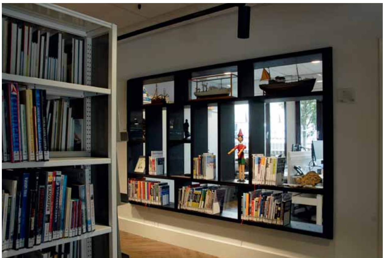
FOTO ONDER Vitrineraam naar het kantoor van de bibliotheekmedewerkers.

FOTO BOVEN Doorkijk vanuit de studieruimte naar de bibliotheek.