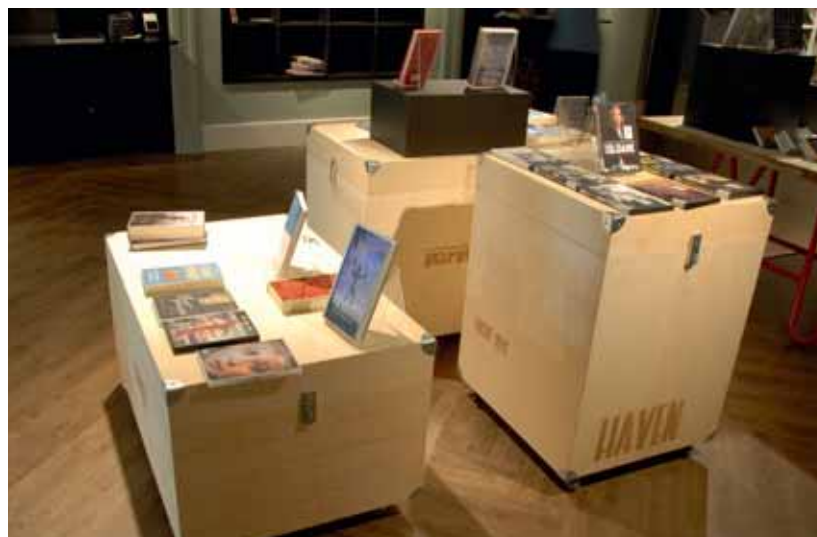
FOTO LINKS Doorkijk naar de afsluitbare studie-annex presentatieruimte.