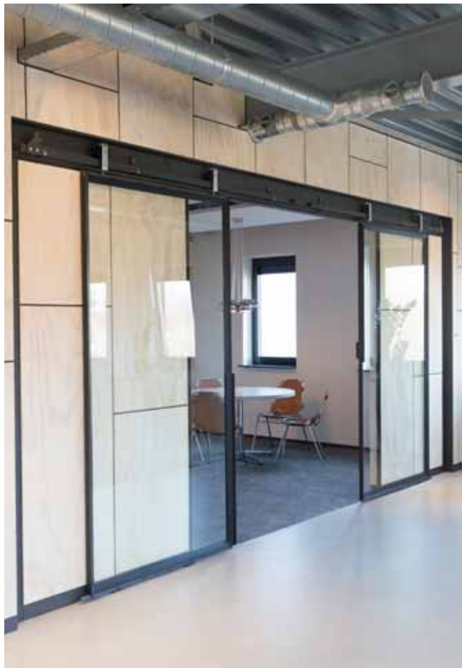
FOTO LINKSBOVEN Afgescheiden overlegruimte.