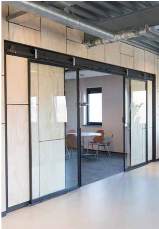
FOTO LINKSBOVEN Afgescheiden overleg ruimte.